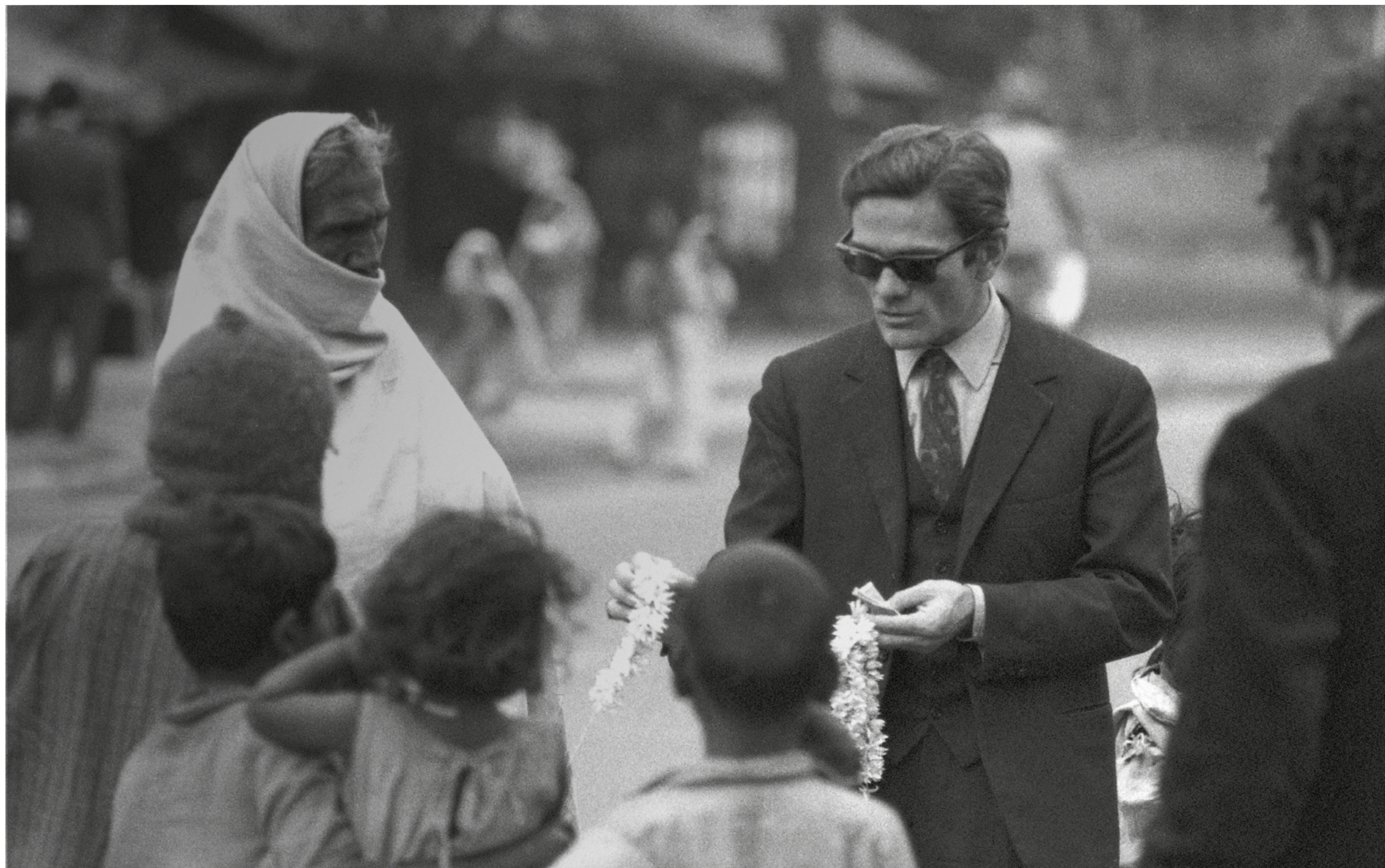
© Gianni Barcelloni/Cineteca di Bologna, fotografia dalle riprese del documentario Appunti per un film sull'India (1968)