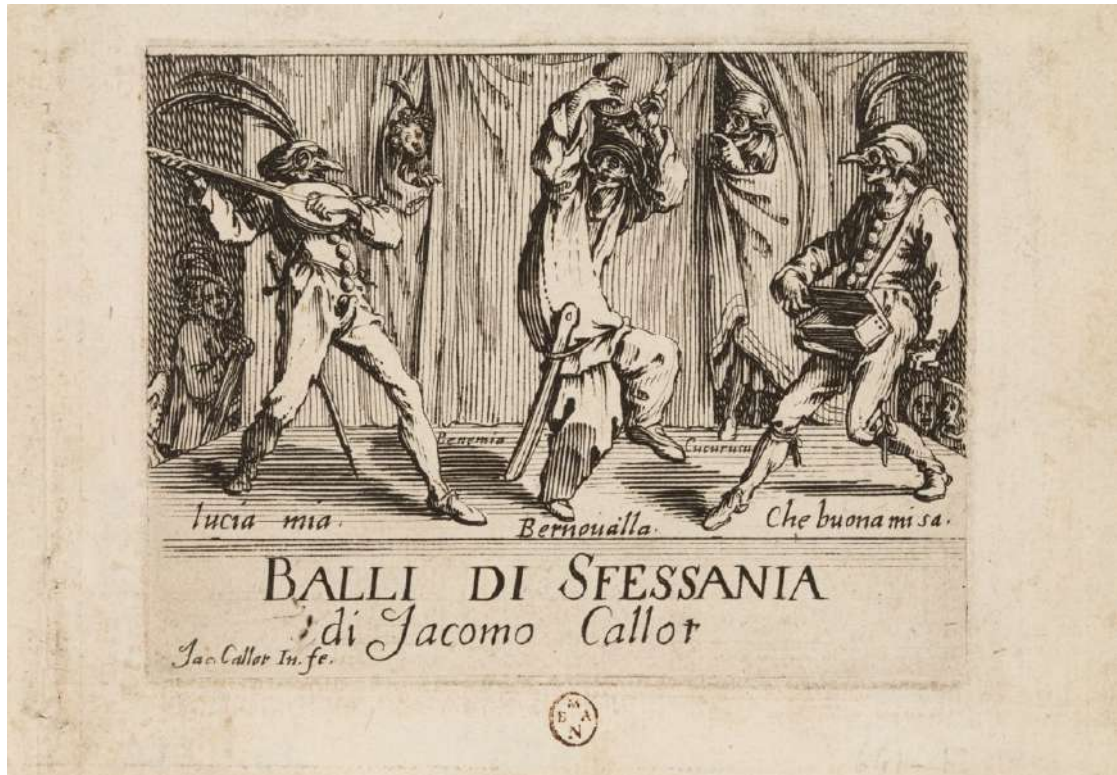
Jacques Callot (1592 - 1635) Frontispice de la série des Balli di sfessania - Eau-forte rehaussée au burin Inv.40.1.357 Nancy, musée des Beaux-Arts